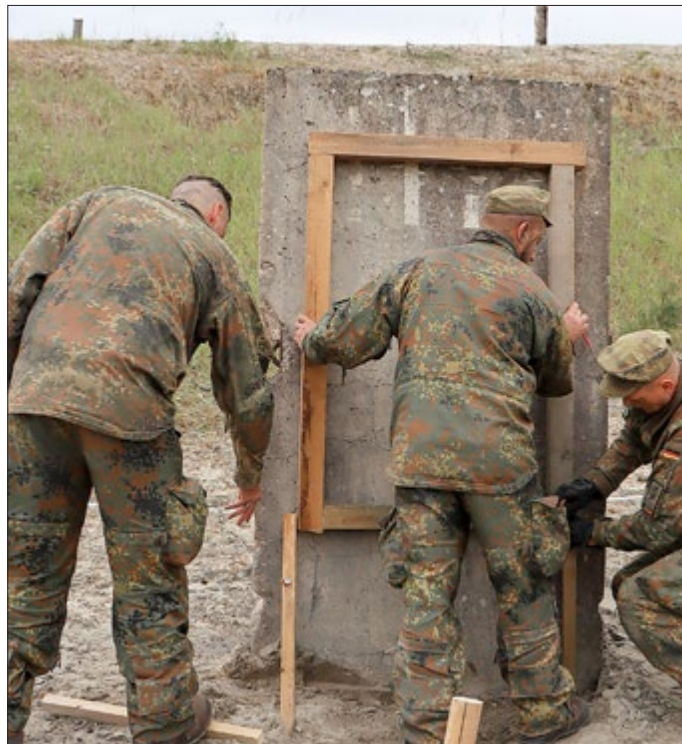
Die Geraer Panzerpioniere bereiten eine Sprengung auf dem Truppenübungsplatz Bergen vor (Beispielbild).

Weitere Informationen zur Pioniertruppe und der Übung „Quadriga 2024“ finden Sie auf Bundeswehr.de