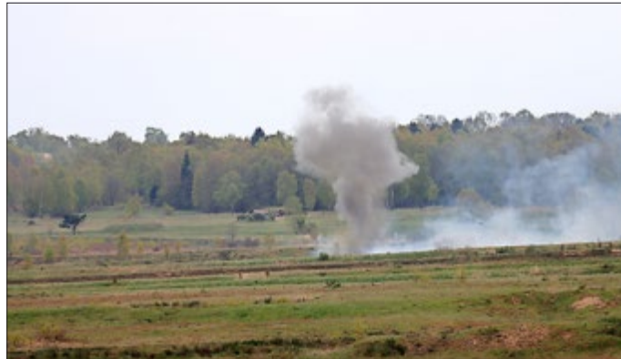
Die Geraer Panzerpioniere Sprengen auf dem Truppenübungsplatz Bergen (Beispielbild).